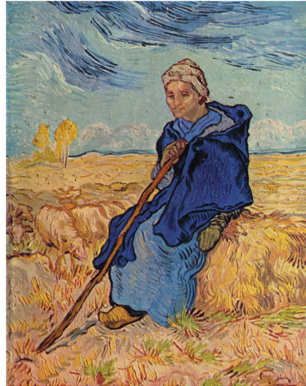
Vincent van Gogh, Shepherdess

The Lord is my shepherd; ... Yea, though I walk through the valley of the shadow of death, I will fear no evil: for thou art with me; thy rod and thy staff they comfort me.