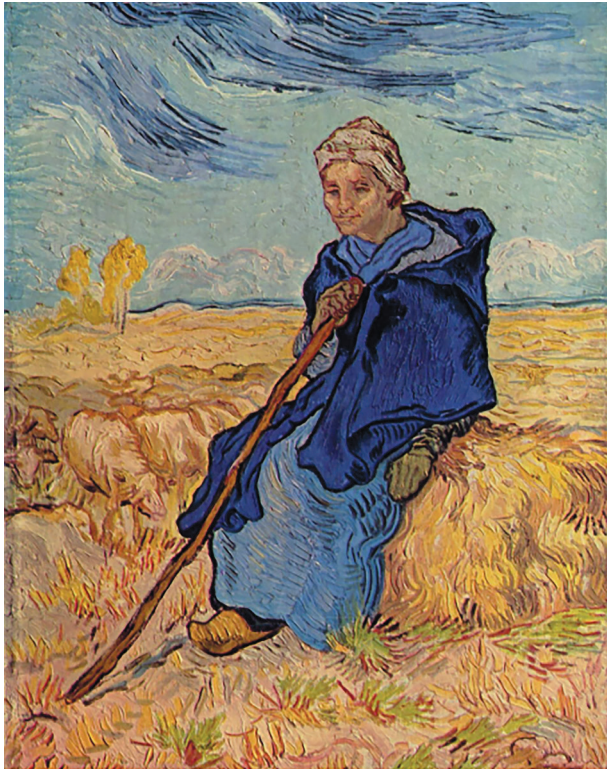
Vincent van Gogh, Pastýřka

Hospodin je můj pastýř; ... I když půjdu roklí šeré smrti, nebudu se bát ničeho zlého, vždyť se mnou jsi ty. Tvoje berla a tvá hůl mě potěšují.